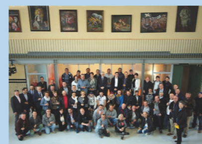
Umbau altes Elektrizitätswerk in Naumburg (Saale) zu >Kunstwerk im Turbinenhaus< feierliche Eröffnung im April 2017 Gebäude und Freianlage, barrierefreie Einrichtung, Erhalt histor. Einbauten, Turbinenfundament, Lastenaufzug, Laufkatze, Verschattung