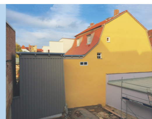
Sanierung Dach und Fassade Wohnhaus, Naumburg (Saale) Richtfest September 2017 Deckmalrechtl. Genehmigung, Vergabe, Bauüberwachung