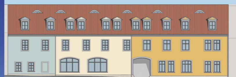
Umbau Geschäftshaus in ein Mehrfamilienhaus, Naumburg (Saale) barrierefreie Wohnungen, Aufzug, Balkone, Carport Laubengang - Vorplanung