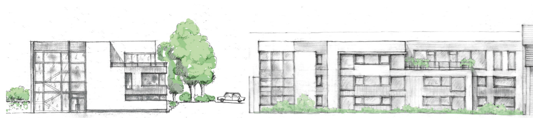
Neubau Mehrzweckgebäude und Verwaltungsgebäude in Naumburg (Saale) Vorplanung - Erstellung von Nutzungskonzeptionen, Fassadenentwurf, Gründach, Verschattung, Freiraumplanung