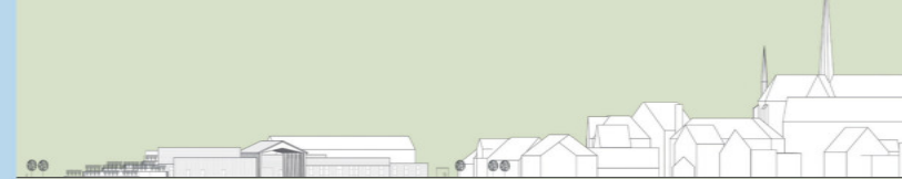
Ansicht Straße mit Klosteranlage