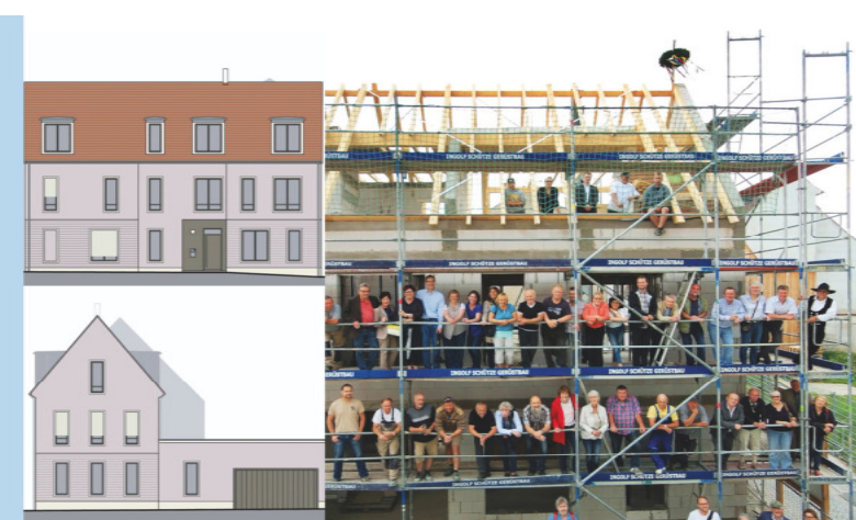
Neubau Stadthaus in Naumburg (Saale) - Richtfest Juni 2017 Mikropfahlgründung 10 m, Erdwärme u. Kühlung, KfW70, Aufzug, barrierefrei, Verschattung mit textilem Sonnenschutz - Vergabe, Bauüberwachung