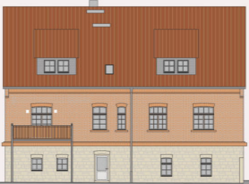
Anbau eines Balkons, »Alte Schule Lengfeld« Neue Fassadenöffnung, Stahlbalkon, Beleuchtung