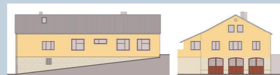
Umbau Werkstatt (Schmiede) zu Zweifamilienwohnhaus, Großheringen Gebäude und Freianlagen, Bestandsaufnahme und Vorplanung