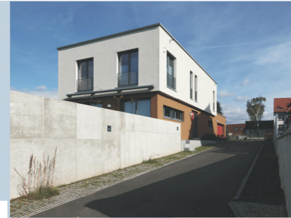
Neubau Wohn- und Geschäftshaus in Naumburg Gebäude und Freianlagen, KfW-Effizienzhaus 55, Erdwärme mit Erdsonden, Regenwassernutzung