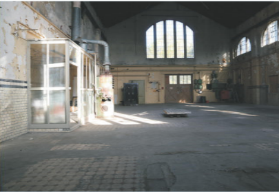
»Kunstwerk im Turbinenhaus«, Umbau altes Elektrizitätswerk in Naumburg zu Kultur- und Kunstzentrum Gebäude und Freianlage Bestandsaufnahme, Genehmigungsplanung, Darstellung Farbansicht