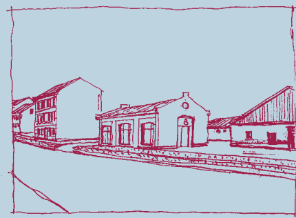
Umbau Gewerbehof und Freianlagen Gestaltungsvorschlag