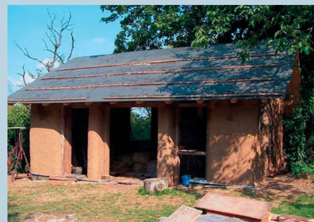
Strohballen-Gartenhaus in Naumburg Neubau: Strohballen d=55cm, Lehmputz; Dachziegel und Fachwerk in Wiederverwendung