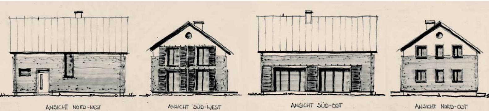
Einfamilienhaus in Goldschau Neubau mit Bodenkollektoren, Erdwärme- und Regenwassernutzung