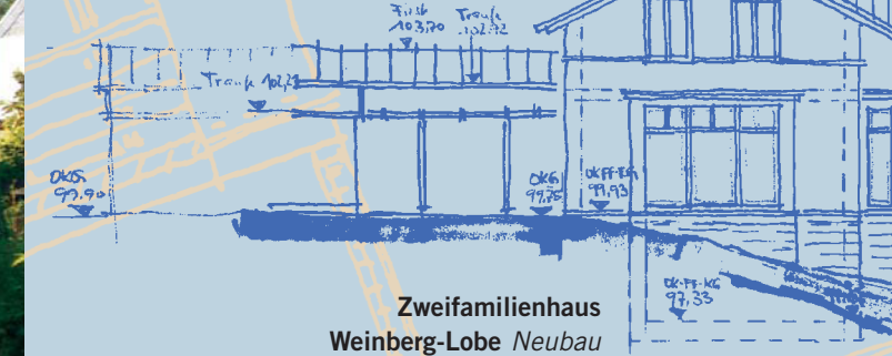
Zweifamilienhaus Weinberg-Lobe Neubau