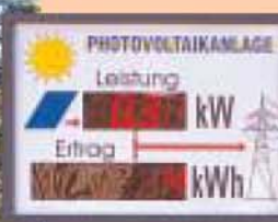
Umgestaltung Jugendhaus OTTO Anzeigetafel der Photovoltaikanlage