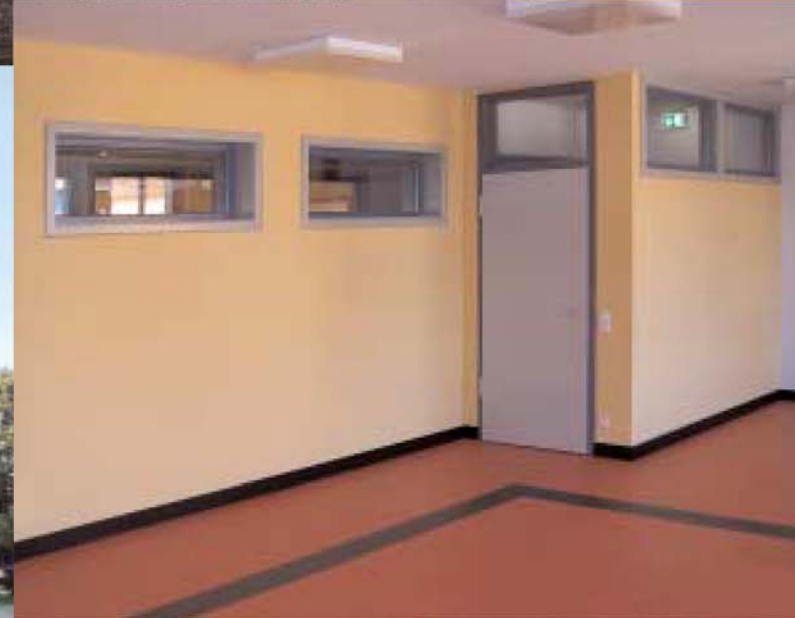
Umgestaltung Jugendhaus OTTO verschiedene Ansichten