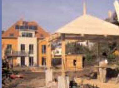
Neubau Zweifamilienhaus im Bürgergarten Naumburg bezogen