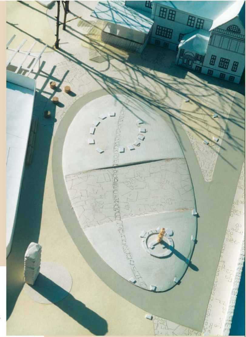
Umgestaltung Jugendhaus OTTO oben: Modell der Außenanlage mit Gebäude links: Farbentwurf unten links: Werkplanung einer Außenterrasse unten: Detailmodell Zaunanlage